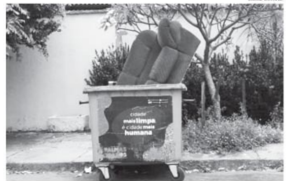
Na 1.104 Sul um sofá foi jogado dentro de coletor de lixo doméstico

O Carnaval do Amor será realizado na Praia da Graciosa, durante os cinco dias da festa. A Fundação Cultural irá apoiar o evento com estrutura e atrações locais e nacionais em processo de definição, além de disponibilizar tendas para os blocos participantes. Para a organização da festa haverá chamamento público para os blocos, comer-