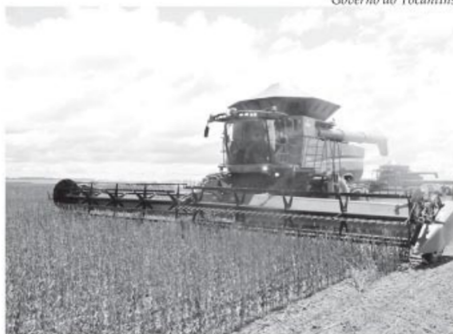
Colheita de grãos da próxima safra deve ultrapassar 5 milhões de toneladas

Uma equipe do Instituto de Desenvolvimento Rural do Tocantins (Ruraltins) esteve nesta sexta-feira, 24, na Comunidade Quilombola Barra da Aroeira, município de Santa Tereza, para